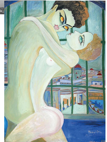
pintura de Nahui Olin →