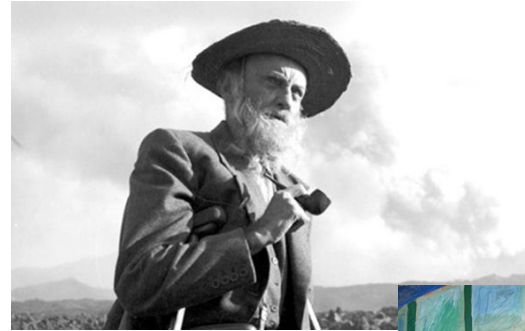
Doctor Atl ↑