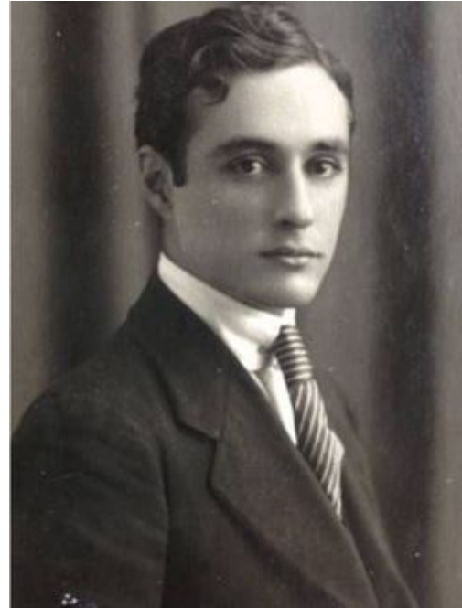
El marido Lozano